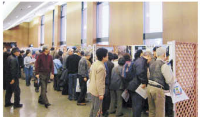
多くの人でにぎわう記紀・万葉ゆかりの地のPRブース