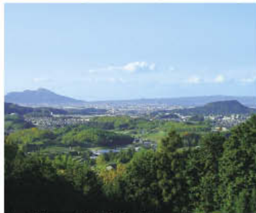
明日香村より二上山(中央左奥)と畝傍山(中央右)を望む

知事からひとこと 記紀・万葉集をはじめとする古典作品には、日本文化の源流につながるさまざまな記述があり、ゆかりの地は全国各地に存在します。 この「記紀・万葉プロジェクト」をきっかけにして、奈良県のみならず日本のさまざまな地域の人のひとの「自分たちの住む地域の魅力再発見」につながることをめざします。