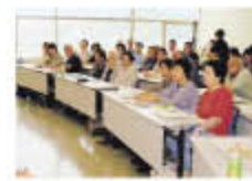
平成22年度の教室より