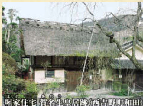
堀家住宅 賀名生皇居跡(西吉野町和田)

南北朝時代、京の都を追われて吉野へ向かう後醍醐(ごだいご)天皇を手厚くもてなした邸宅は、その後、後村上(ごむらかみ)、長慶(ちやうけい)、後龜山(ごかめやま)天皇の皇居に。ひっそりとした佇まいは、南朝の哀しい歴史を刻んでいる。