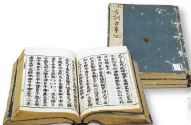
訂正古訓古事記 明治3(1870)年刊

奈良に住み、あるいは奈良を訪れる人びとが、長い年月守り伝えられてきたさまざまな歴史的資産に触れ、歴史に対する興味を深め、感動を味わえるような取り組みを行います。