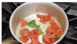
中火から弱火で煮る

② 鍋にバージンオリーブオイル、①のトマト、塩、バジルの葉をちぎったものを入れて、中火にかける。グツグツと沸いてきたら、ふたをして弱火にする。5分ほどしたらふたを開け、トマトが軽くぐずれたら、火を止めて、氷にあてて冷ます。