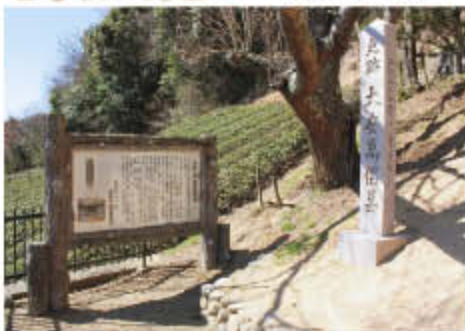
神田阿礼が読み上げた内容を編集して古事記を完成させた太安万侶の墓。平城宮跡の東約10kmの辺り。昭和54年に、茶畑から墓誌や遺骨が発見された。