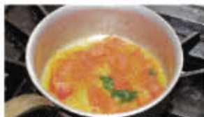
この状態になったら火を止める

③ 大和丸なすは皮をむいて、2cm角のサイコロ状に切り、180度で30秒くらい素揚げする。