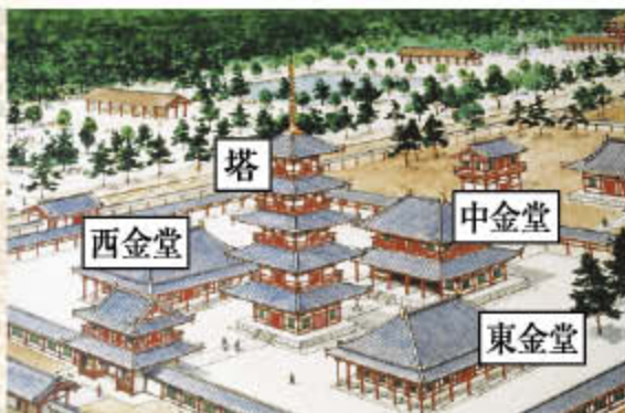
創建当時の飛鳥寺(イラスト)

日本最初の本格的伽藍 がらん による寺院「飛鳥寺」は、日本書紀によると、「587年に蘇我馬子が建立を発願し、翌年の588年に馬子の要請を受けて、百済が僧や寺院建築の技術者を派遣し、596年に完成した。」とあります。工事着工から完成まで8年という短期間であったのは、百済からの各分野の技術者の援助が背景にあると考えられています。伽藍の配置は、一塔三金堂式という塔の東、西、北に3つの金堂を置く様式でした。この伽藍配置は、高句麗の上五里寺址、定陵寺、新羅の皇龍寺址などでしか見られません。