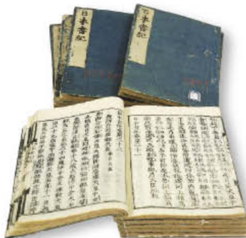
日本書紀 黒羽領主蔵版 文政3(1820)年刊

日本に伝わる最古の歌集。天皇や貴族だけでなく、兵士や農民まで、さまざまな人々が詠んだ約1400年～1300年くらい昔の歌が収められている。全部で20巻あり、約4,500首が収録され、奈良の地名が詠みこまれた歌は約900首とも。季節(自然)、愛や恋、旅などをテーマにしたものから、笑いを誘う滑稽なものまで実に多彩で、その素朴でおおらかな歌風は現代に生きる私たちに親しみと共感を与える。