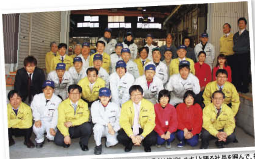
「みんな同じ潜水艦の乗組員。誰一人欠けても、『昭和号』は沈没します」と語る社長を囲んで、社員の皆さん