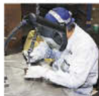
チタンの釣り用具を手際よく溶接する

※光触媒 光を利用して化学反応を起こさせ、水中や空気中の汚染物質を酸化分解すること。