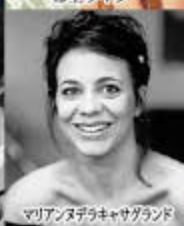
マリアステラキッサグラント