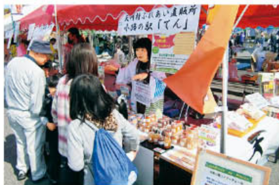
被災地域による物産展の様子(イメージ)