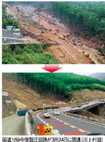
国道169号仮設迂回路が3月24日に開通(川上村道)