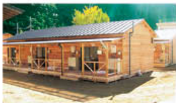
県産材を使用した木造の応急仮設住宅(十津川村)

全壊世帯、および現行制度では支援の対象とならない半壊世帯に対する支援。 ・医師、看護師、保健師等を避難所等に派遣し、診療や健康診断、健康相談などを実施。併せて、被災者の心のケアを実施。 ・ボランティアによる支援体制の整備。