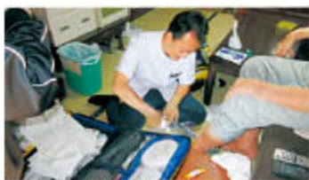
十津川村内での往診

・応急仮設住宅の設置(五條市、野迫川村、十津川村)および入居者が使用する生活家電等のレンタル。 ・被災地域のうち、国の被災者生活再建支援法が適用されない黒滝村の