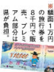
※額面1万円の旅行券を8千円で販売、プレミアム部分は県が負担。

・南部地域への宿泊を伴う各種会議等の開催経費に対し補助。 ・中小企業等の事業再建のための制度融資等。 ・被災温泉施設の復旧支援。 ・県産材を使用した木造の応急仮設住宅を建設(野迫川村、十津川村)。