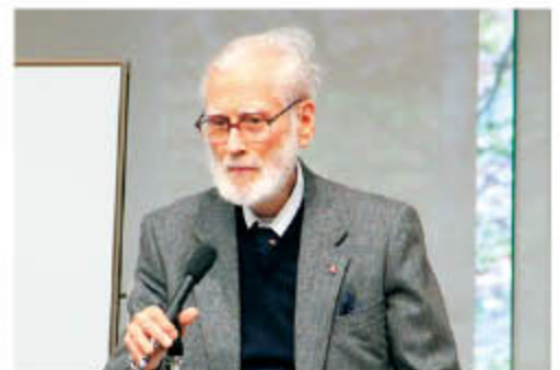
クラントンさんの記念講演

さんが「歌の力」をテーマに特別講演をしました。 「万葉集」は、1300年以上の時を超えてもなお、多くの人々の心を魅了する、世界に誇れる文化遺産です。県では、国際的な「万葉集」研究などのさらなる推進を図り、その価値を高めていきます。