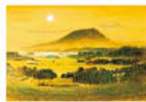
井上稔 欽傍山 〈耳成山・香具山も展示予定〉

万葉のふるさと大和-万葉コレクションから- 大和を描いた作品を中心に、当館所蔵の日本画を展示します。それぞれの画家の眼を通して、大和の魅力を感じてください。