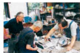
あくなみ窯教室風景