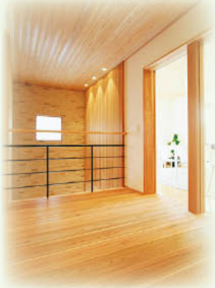
木造住宅の内装イメージ

県民の方からいただいた「ご意見」や「ご質問」と 県から「お答えした内容」をご紹介します。