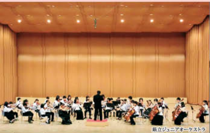
県立ジュニアオーケストラ