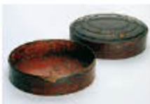
東京大学所蔵 鏡を入れる容器(王野轟)

開催中～6月17日(日) 一般 800(500)円 大・高 450(350)円 中・小 300(250)円