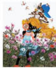
「コスモスは詩う」2003年 © Seiji Fujishiro/Hori Pro

日本における影絵作家の第一人者、藤城清治。88歳を迎えてなお精力的に創作活動に向かい、独自の世界を切り開き多くの人々に夢と希望、そして癒しを与え続けています。光と影が奏でる美しいシンフォニーをどうぞお楽しみください。