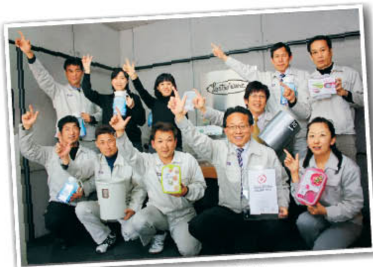
日本最古の都 奈良から、世界一の商品づくりを目指す従業員の皆さん

プラスチック家庭用品で、 日本トップクラスのシェアを誇る 会社が奈良県にあった！