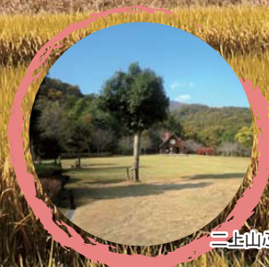
二上山ふるさと公園