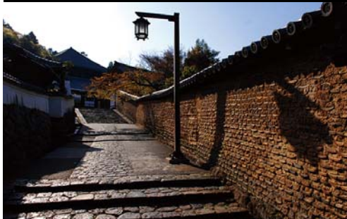
二月堂に続く裏参道

東大寺に、行ったことがありますか？ 初めて訪れると、まずは大仏さまの大きさに、息を呑むことでしょう。 壮大なスケールに目を奪われがちですが、広大な境内をぐるり見回せば、 魅惑のエピソードがあちらこちらに。 かつて、高さ約100mもある塔が2つ、並び建っていました。 かつて、東大寺は、今よりもはるかに大きな規模でした。 かつて、東大寺が戦火に巻き込まれた際、骨身を惜しまず、再建に尽くした人々がいました。 知っているようでいて、実はよく知らなかった東大寺。 その深遠なる世界を今、じっくり訪ねてみませんか。