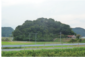
八口神社から見た草枕