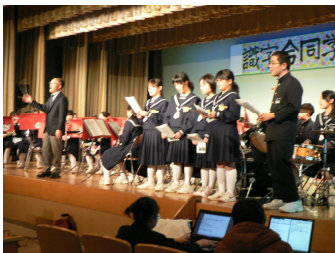
[オープニング演奏]

人の優しさや勇気、心のふれあいが、詩や小説、落語等の作品を通して豊かな表現で語られ、言葉や文字のもつ力の大きさ、表現することの大切さや素晴らしさを共有することができた。