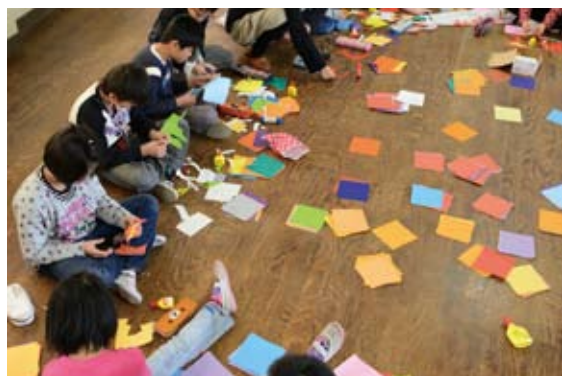
ワークショップの様子 (2012)