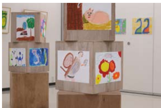
HAPPY SPOT NARA での展示風景 (2013)