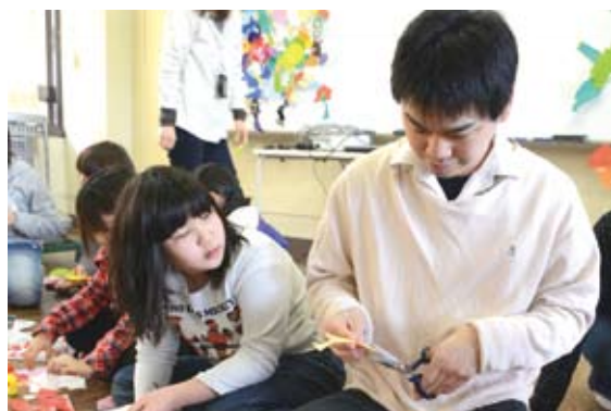
ワークショップの様子 (2012)