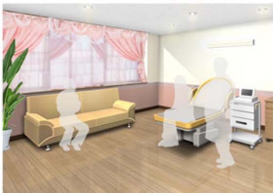
産科病棟 分娩室 (イメージ)