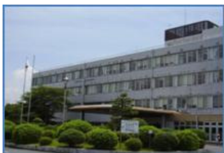
地域医療センター（県立五條病院を改修）