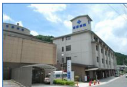
地域医療センター（国保吉野病院を改修）