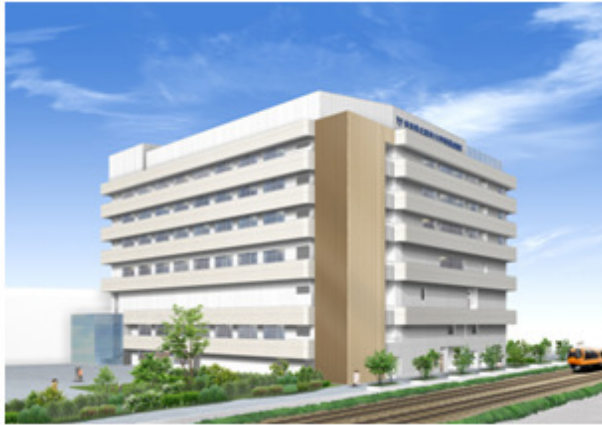
（仮称）中央手術棟整備イメージ

平成 21 年度に策定された奈良県地域医療再生計画に基づいて、県立医科大学附属病院を中南和地域における拠点となる高度医療拠点病院としてさらなる整備充実を図るため、新たに建設工事を進めているものです。