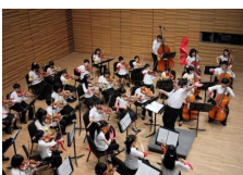
「県立ジュニアオーケストラ」