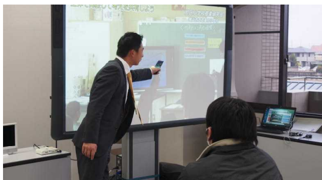
演習（電子黒板の活用）