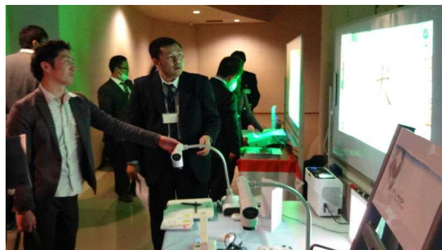
演習（書画カメラの活用）

参加者のアンケートには、「今までとは違う活用方法を知ることができた。」「校内研修に役立てたい。」などの感想がありました。今後、各校でのICT活用指導力向上にむけた校内研修の活性化につながることを期待します。