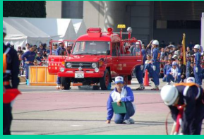
全国消防操法大会 の様子