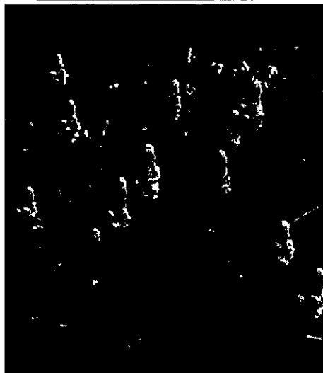
写真1. キャンドルブッシュ

センナの同属植物であり、小葉・葉軸・茎・花などにも、センノシドが含有されていることが報告されています。