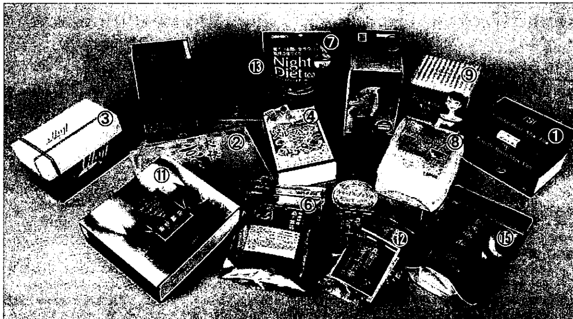
写真2. テスト対象銘柄

インターネットの通信販売及び大手ドラッグストア等で購入可能な銘柄を中心に、「キャンドルブッシュ」「ゴールデンキャンドル」「ハネセンナ」「カッサア・アラタ」が原材料一覧の上位に記載されているティーバッグタイプの健康茶15銘柄をテスト対象としました(写真2、表1)。