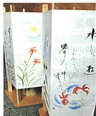
手作り行灯には、和歌や美しい絵が描かれたものも。

「奈良もてなしの心推進県民会議」では、生き生きとした生活や交流を育むまちづくりを実践している地区を、「もてなしのまちづくりモデル地区」として認定。天理市柳本地区もその一つです。