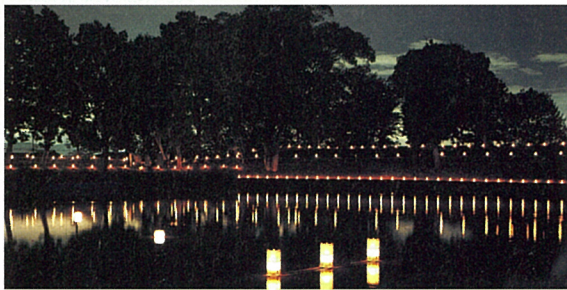
暗闇に前方後円墳のシルエットが浮かび、幻想へといざなう。

*両日共「山の辺のあかり」として長岳寺(ちょうがくじ)千燈会(せんとうえ)も同時開催。