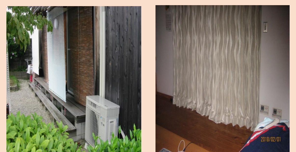
③環境団体メンバーと大学生がコラボした取組

省エネアプリを活用し、実践できる省エネ対策を計画し、 窓の外にブラインドを設置するなど実践し、 どれくらい省エネできているか測定し確認することは、 PDCAサイクルを意識した取組で、エネルギーを 効率的に使えます。