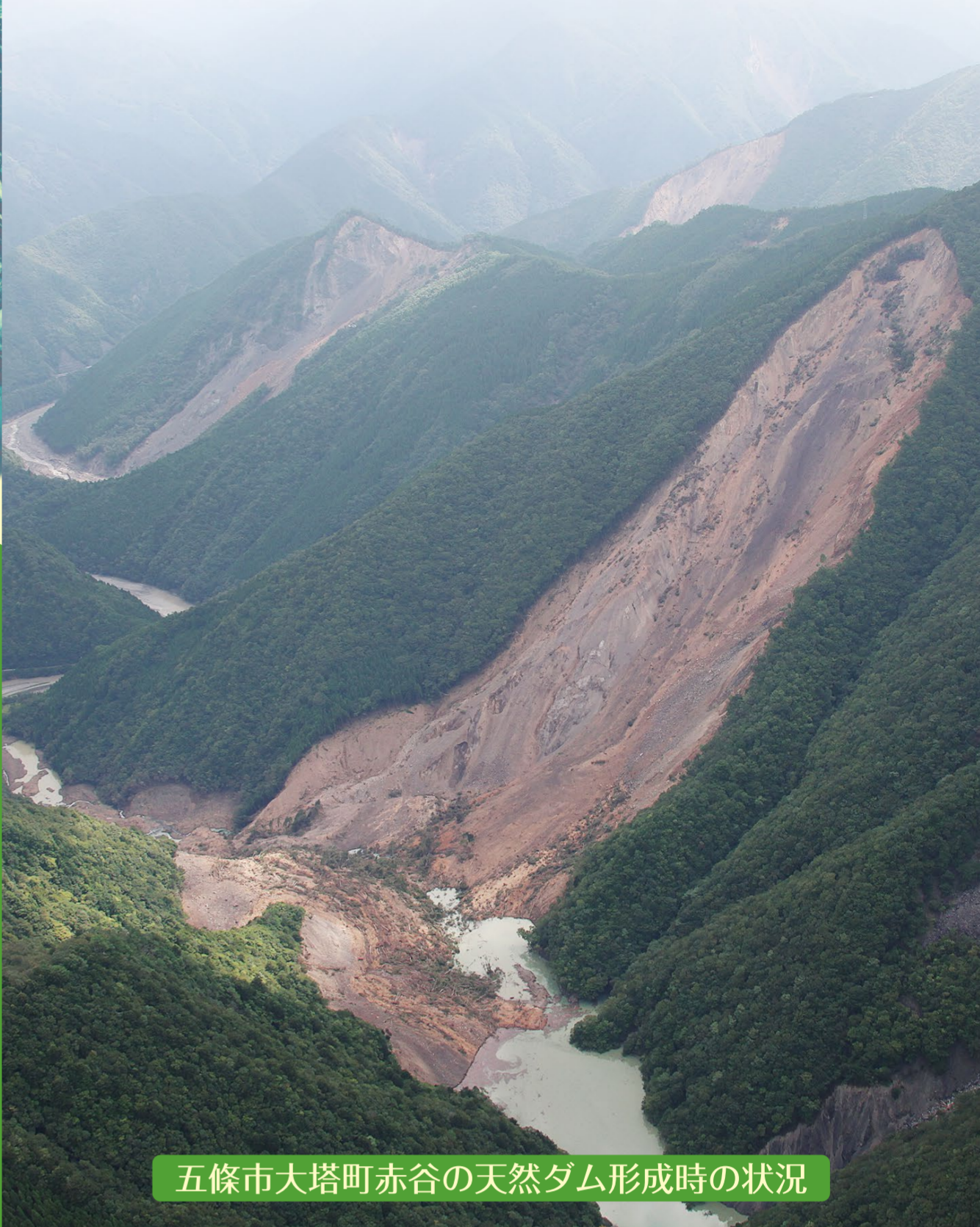
五條市大塔町赤谷の天然ダム形成時の状況

主催:インタープリバント2014実行委員会、環太平洋インタープリバント協議会 共催:International Research Society INTERPRAEVENT、(公社)砂防学会 後援:国土交通省、奈良県 協賛:(一社)国際砂防協会、(一社)全国治水砂防協会、(一財)砂防・地すべり技術センター、(一財)砂防フロンティア整備推進機構