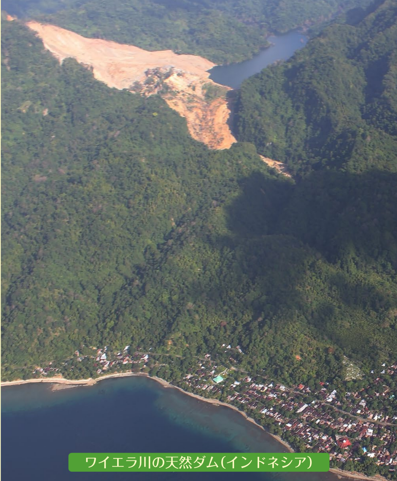
ワイエラ川の天然ダム(インドネシア)