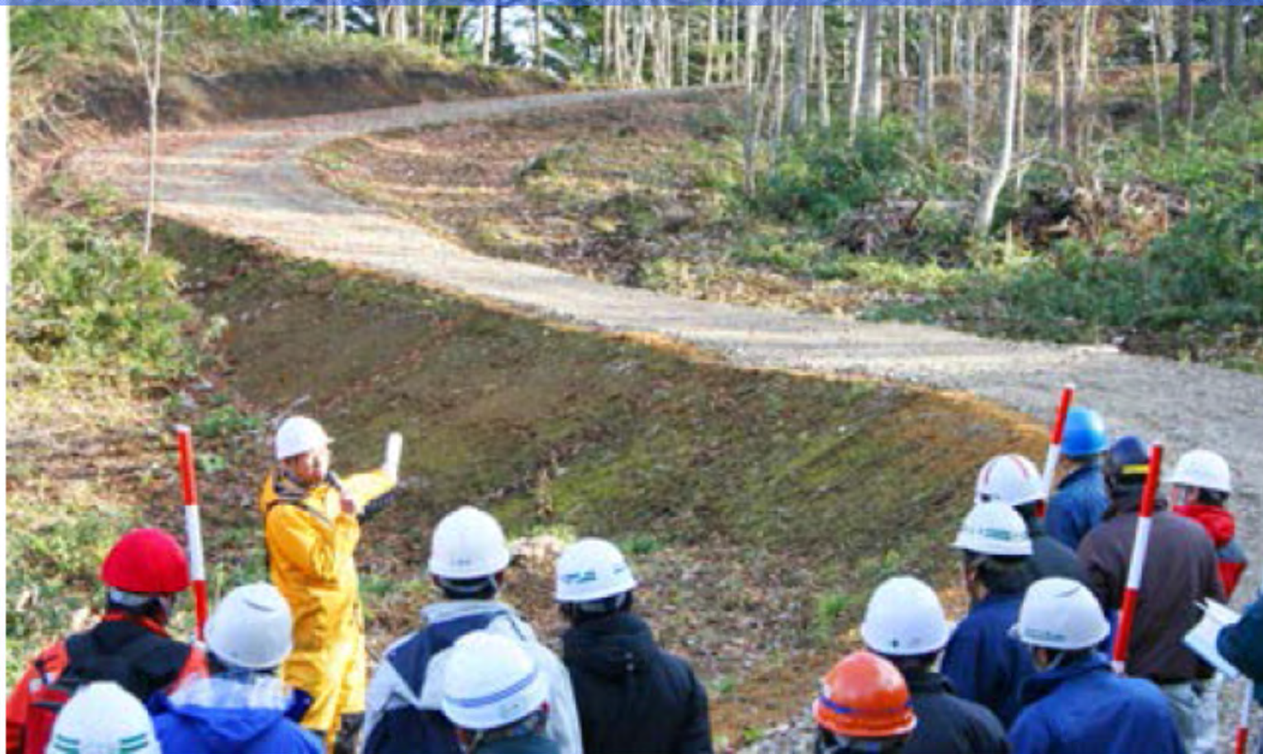
写真－3 林業専用道技術者研修での現地実習