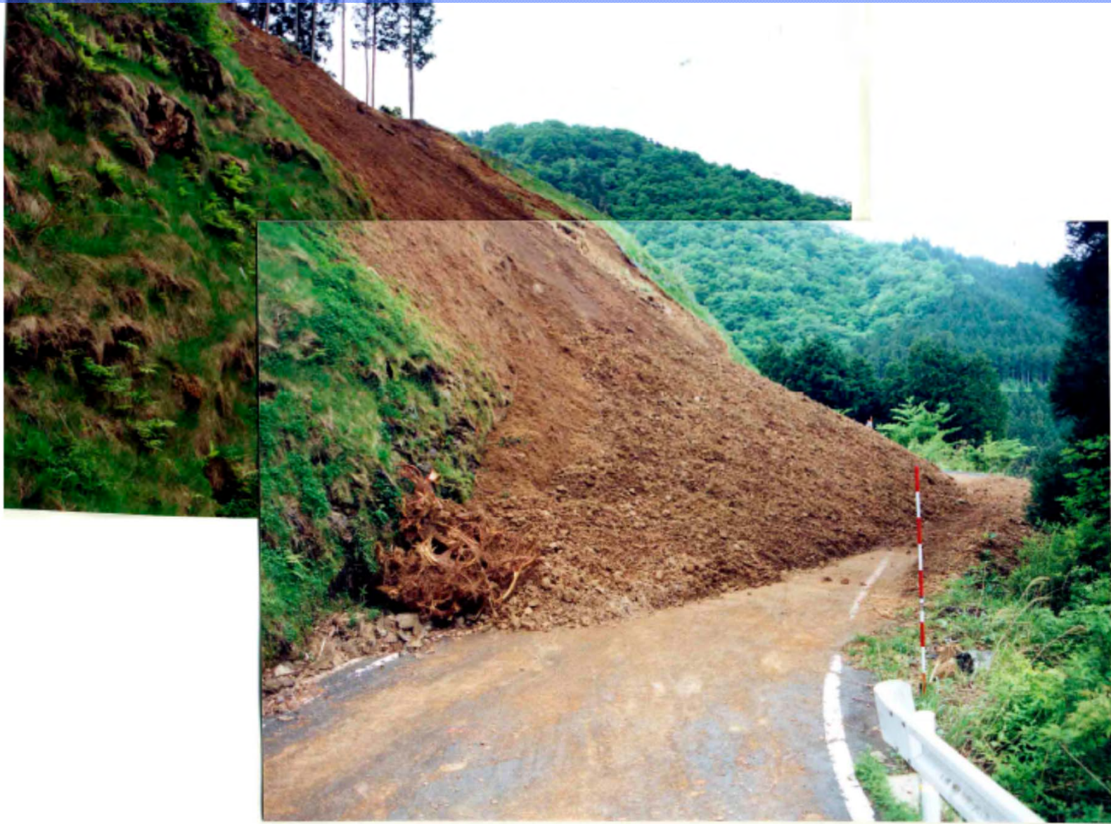
H18 広域基幹林道 吉野大峯線(奈良県吉野郡吉野町～天川村)の被災状況