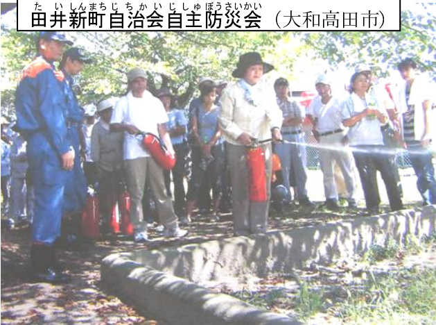
たいしんまちじちかいじしゅぼうさいかい (大和高田市) 田井新町自治会自主防災会