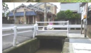
橋を高くする(右側は大雨時の水路)