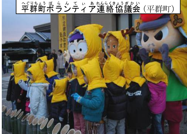
へぐりちょうぼらんていあれんらくきょうぎかい (平群町) 平群町ボランティア連絡協議会