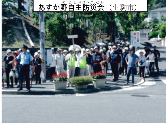
のじしゅぼうさいかい (生駒市) あすか野自主防災会