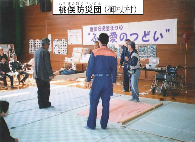
ももまたぼうさいだん (御杖村) 桃俣防災団