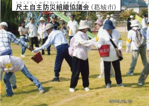
しゆくどじしゅぼうさいそしききょうぎかい (葛城市) 尺土自主防災組織協議会