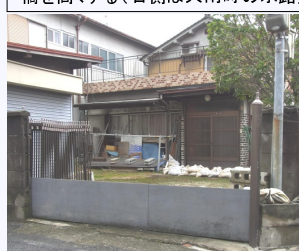
浸水常襲の住家を止水板と土のうで守る