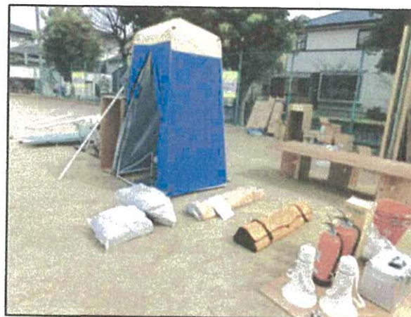
マンホールトイレ