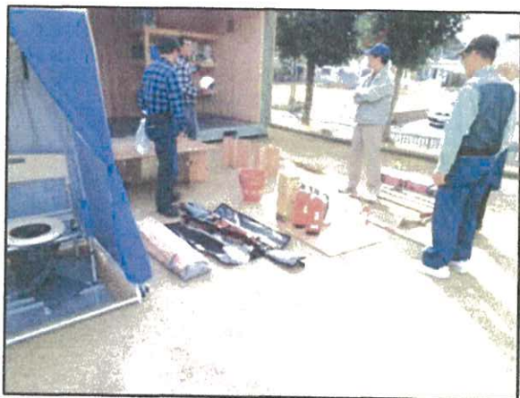
工具セット、消火器等

自主防災会の防災委員が毎年2月頃に防災備品の定期点検を行い、動作確認と点検手入れを行い、チェーンソーで丸太を切るなど実際に即した訓練をしています。