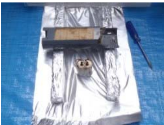
コンデンサ取り外し作業終了