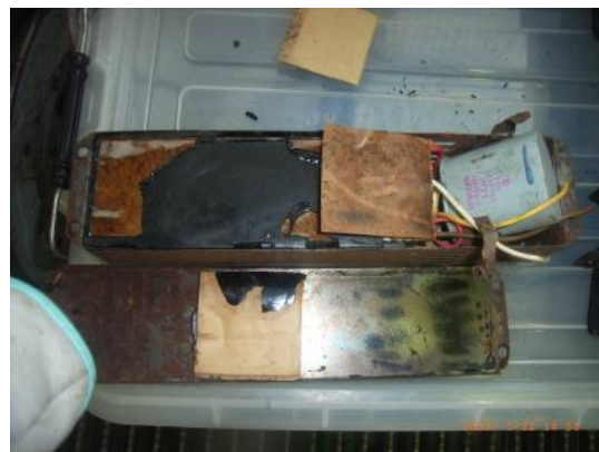
スリット付きケースの場合