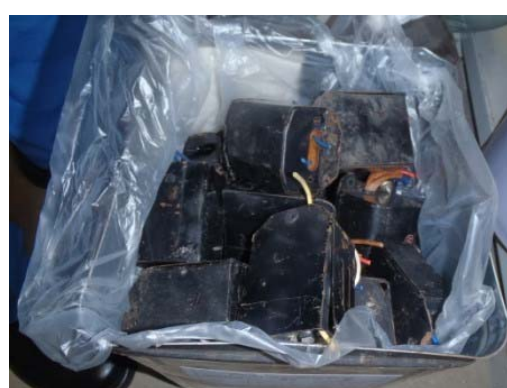
切断された廃安定器の保管例 (3)