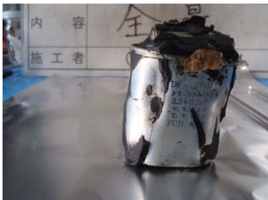
変形した剥き身コンデンサ（１）

充填材を剥いて取り出したコンデンサには、変形している事例、破損・漏洩等を目止め材で補修した事例や油状の液体が多量に付着している事例が散見される。