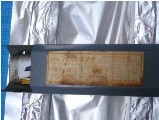
コンデンサ外付け型安定器