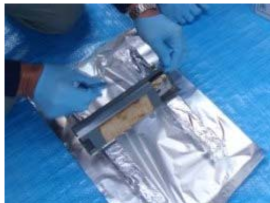
コンデンサ取り外し作業中