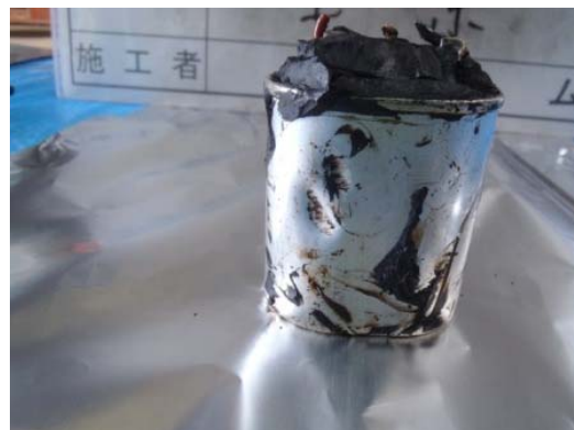
変形した剥き身コンデンサ（２）