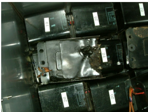
切断された廃安定器の保管例 (2)