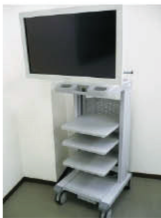
▲内視鏡モニターなどを収載する医療用モニターカート。

術を生かし、医療用機器を作っています。複雑化している医療用電気機器や画像処理装置をすっきり収納できる医療用モニターカート、外科用手術器具、その器具のスムーズな術前準備を可能にする滅菌ケースなどがあります。注文があった製品を単に作るだけでなく、従業員が手術の手順を学び、医師や看護師さんの使いやすいさを第一にご相談に応じて自社の企画を提案していきます。