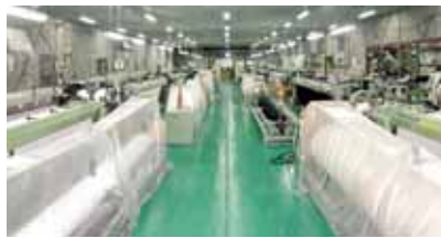
さまざまな織機を稼働して商品を製造している 本社工場

当社はもともと「蚊帳」をつくっていたのですが、今ではほとんど需要がなくなり、現在は、蚊帳の染織技術を応用したいろんな製品をつくっています。メインの製品は「寒