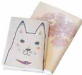
蚊帳と同じ粗目素材でできたふすま地を使用した「ふすま地ブックカバー」。温かみのある手触りが特長です。

昨年初めて、ニューヨークギフトショー(展示会)に出展しました。欧米は日本と文化が異なるので、日本で販売している製品をそのまま売るのは難しいと思いますが、