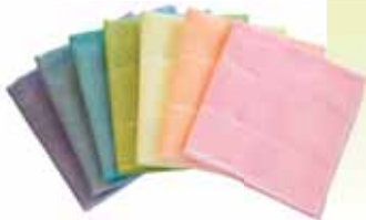
社長オススメ、丈夫で吸水性のある「夢ふきん」

秘訣なんてありませんよ笑。ただ、どんな製品にも商品寿命というものがあるのです、多角的に物事を見て、切磋琢磨すること。そし