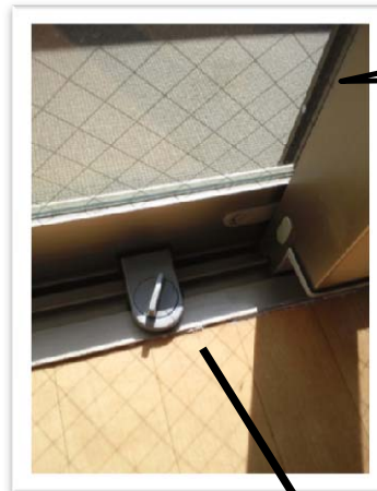
補助錠の 取付状況

振動センサーアラームや補助錠を取り付けましょう。 ※補助錠はホームセンター等で安価で購入できます。