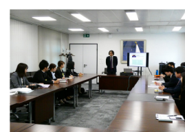
在ジュネーブ国際機関日本政府代表部 ブリーフィング