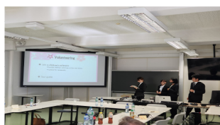
プレゼンテーション発表