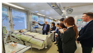
ベルン応用科学大学訪問