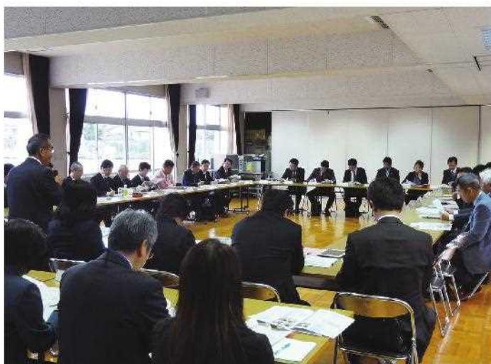
第2回意見交換会の様子 県立高等養護学校にて