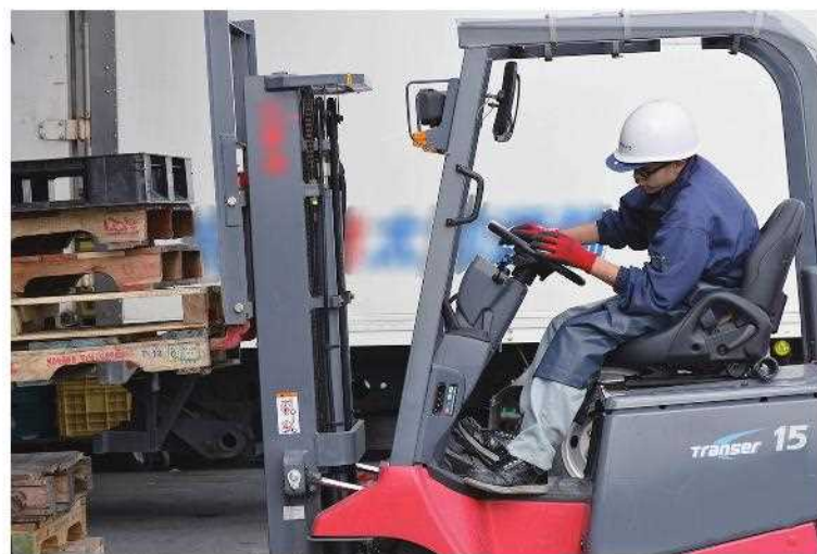
フォークリフトを巧みに操ります

した。失敗することがあっても良いと考え、そのときは、「障害があるから、できなくても仕方がない」ではなく、「どこが間違っただけ失敗したのか」をはっきりと指摘するようにしています。ただ、指摘した後は、必ずフォローをしています。失敗を指摘するだけでは、意欲につながらないと思っています。彼には、試行錯誤しながらも、「仕事を覚え