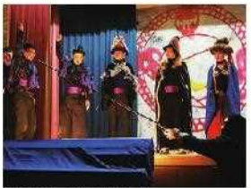
高等部：学習発表会