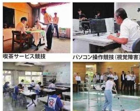
第33回奈良県障害者技能競技大会の様子

「金」が支給されます(詳しくは図1参照)。調整金や報奨金の支給に関する申請書の受付もこちらで行っています。」