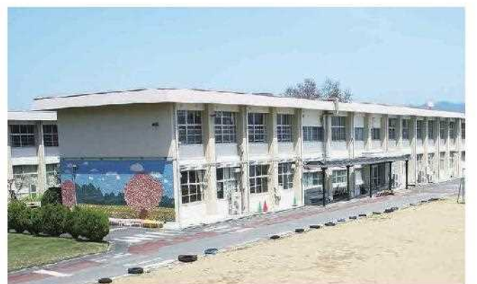
学校スローガンは『元気あいさつ 笑顔いっぱい 一人一人が輝く学校』

「高等部では、本人や保護者と卒業後の進路について懇談をし、1年生の夏休みから4日間(2日×2カ所)の現場実