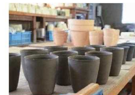
奈良県立大淀養護学校

「奈良県障害者雇用促進ジャーナル」は、県内の企業や経済・労働団体等の皆様に、障害者雇用施策や障害者雇用に関する制度、障害者雇用に関する先進事例などを紹介し、障害者雇用に関する様々な情報を共有していただくことができるよう、奈良県と奈良労働局が共同で発行しています。