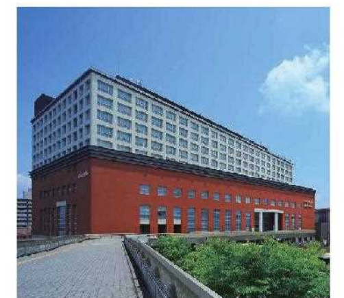
奈良市最多の客室数

平成30年4月1日より法定雇用率の算定基礎に精神障害者が追加されます。ハローワークを通じた精神障害者の就職件数は全国的に急増しており、平成28年度は障害者全体の4割強を占めています。今回は精神障害のある方に焦点をあて、障害の有無に関係なく、持てる力を最大限に発揮できる取組をされているホテル日航奈良を訪ね、障害者雇用のきっかけや、雇用後の様子、また、実際に同ホテルで働く当事者にお話を伺いました。