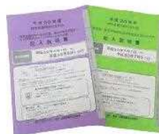
障害者雇用納付金・障害者雇用調整金・報奨金に関する申告申請書の記入説明書(同機構のサイトからダウンロード可能)

「金」が支給されます(詳しくは図1参照)。調整金や報奨金の支給に関する申請書の受付もこちらで行っています。」