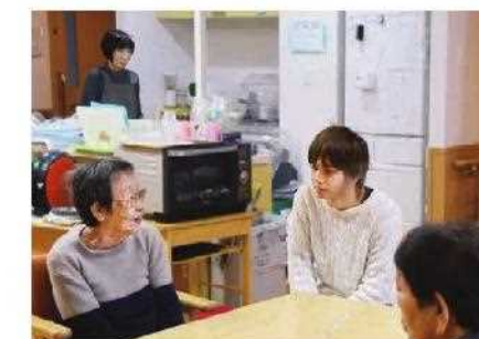
特別養護老人ホーム西ノ京苑