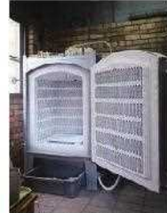
窯業に使用する電気窯