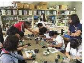
高等部：県立高校との交流

作業選択は3年間を通じて行い、1年生の頃には体力に自信がなかった生徒達が、3年生になると物品運びや立ち仕事にも対応できるようになってくる