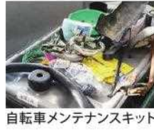
自転車メンテナンスキット