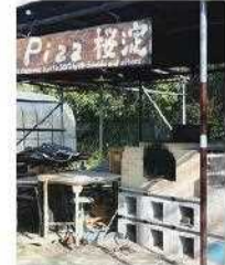
みんなで作ったピザ窯(※1)