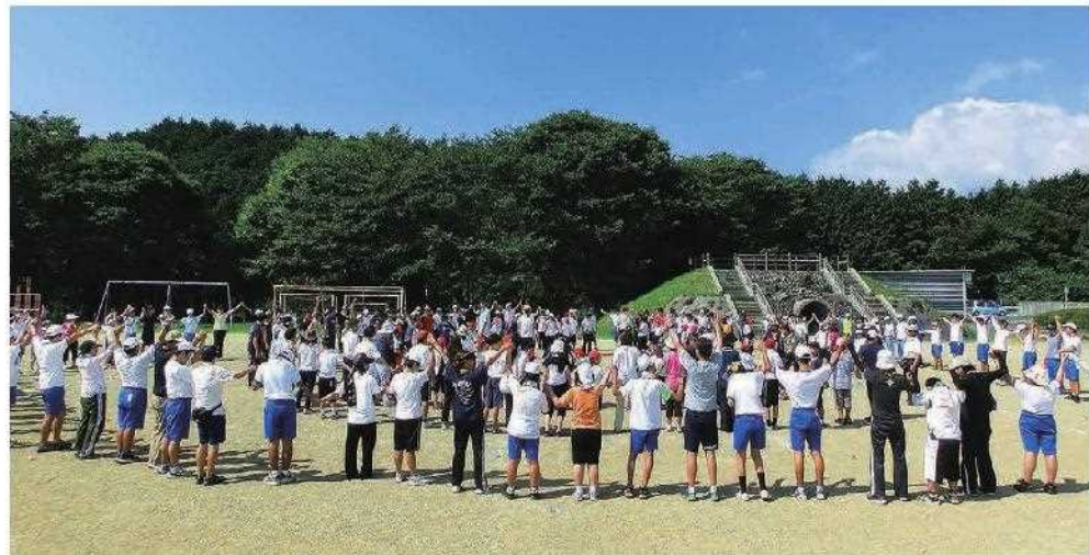
青空の下、全校で取り組む運動会練習(小学部~高等部)