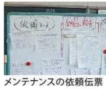
メンテナンスの依頼伝票