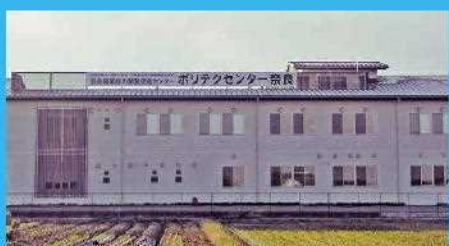
平成30年3月22日からの移転先、ポリテクセンター奈良

開庁時間 8:45~17:00(土日祝、年末年始休暇を除く) URL http://www.jeed.or.jp/location/shibu/nara/