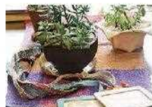
織物(さをり織り)・窯業(植木鉢)の作品