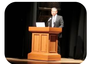
実践報告 (香芝東中コミュニティ協議会)