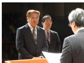
グッド・学校コミュニティ表彰 (高田西中コミュニティ)