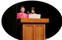
香芝高校生ボランティアによる司会