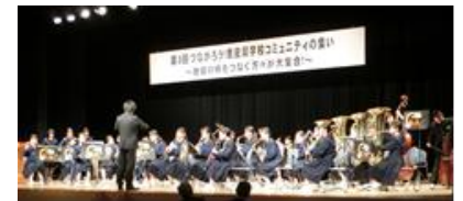
オープニング演奏 (香芝市立香芝北中学校)