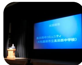
実践報告 (高田西中コミュニティ)