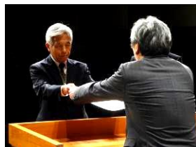
グッド・学校コミュニティ表彰 (香芝東中コミュニティ協議会)