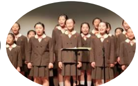
五位堂小学校合唱部