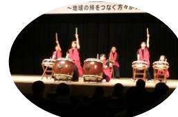
三宅小学校放課後子ども教室華鼓