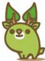
奈良県 エコキャラクタ な〜らちゃん

できることから始めましょう。また、これに合わせ、6月9日10時5分から近鉄奈良駅周辺で街頭啓発を行います。