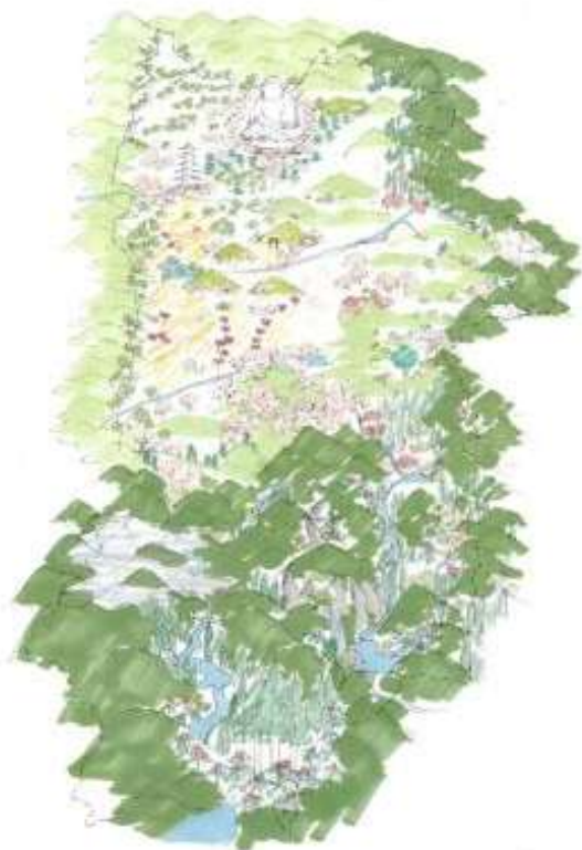
『一つの庭』のイメージ