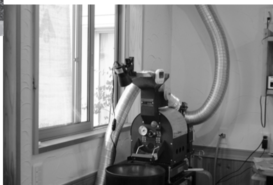
五條市／珈琲の焙煎「珈豆（こまめ）」