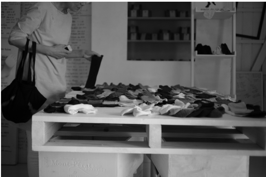
広陵町／生まれたての靴下「Ponte de pie」