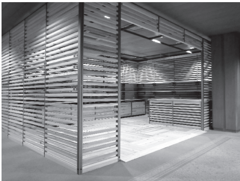
十津川村／ホテル 昴 ロビーショップ

繰り返しになりますが、感度の高い消費者とは、自立している人たちです。他人のチャレンジを評価し、自らも冒険心を持ち、世の中の新しい流れに敏感なアンテナを持つ人たちです。ものごとの善し悪しを判断する目を持っています。時代の流れとともに人生を進め、感動することに価値を見出し、世の中の兆しを早期に感じ取り、自ら情報を収集し、自ら判断し、社会への伝播力のある人たちです。