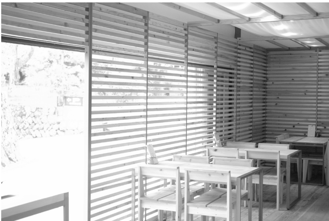
吉野町／葛菓子の製造販売とカフェ「TSUJIMURA」