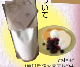
cafe+ (馬見丘陵公園内)提供

特「うふふ」な作品については、「今月のあつぱれ」として、パンケーキミックスをプレゼント。