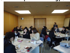
(2~3年目先輩保健師交流会)