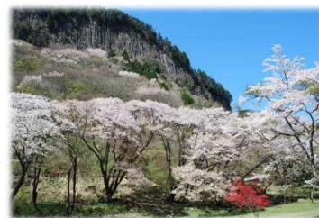
(屏風岩公苑の山桜)