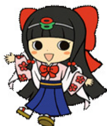
(イメージキャラクター 「蓮花ちゃん」)

【葛城市】 企画部人事課 電話 0745-69-3001 (市HPアドレス) http://www.city.katsuragi.nara.jp