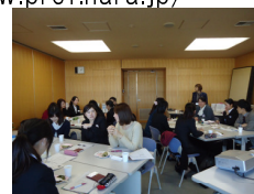
(2~3年目先輩保健師交流会)