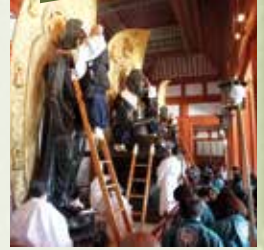
(写真は薬師寺お身拭い) 師走の12月は、1年の無事に感謝し、幸せ多い新年を迎えるための年末行事が、県内各地で行われます。