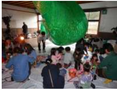
<アーティストトーク(11/8)>