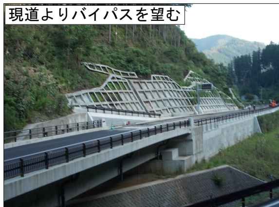
現道よりバイパスを望む