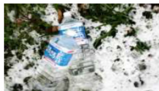
天川村（ごろごろ水）