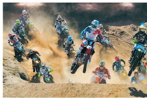
昨年の美術展賞受賞作品

地域住民の美術に対する関心が高めるとともに、芸術を通して交流を図ることを目的として昭和63年度より開催しています。今年は町制施行50周年を祝って、文化ホールで特別展示も行います。