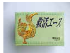
救活エース (生薬強壮剤)