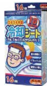
「ひえひえ天国」 冷却シート