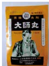
胃腸良剤大師丸 (下痢・食あたりに)