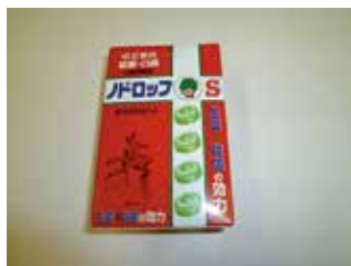
ドロップス(口腔殺菌)