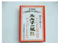
みみずー風散 (鎮痛解熱薬)

<購入先> http://www.tenshindo.co.jp でインターネット販売中