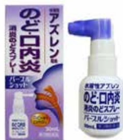
パープルショット