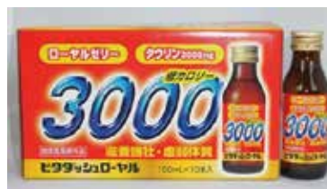
ビタダッシュローヤル