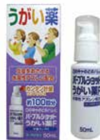
パープルショット うがい薬F