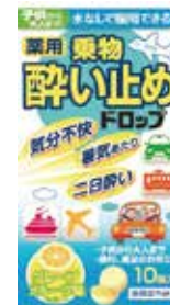
乗り物酔い止めドロップ