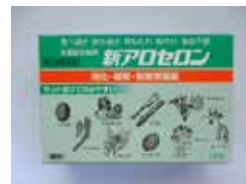
新アロセロン (消化・健胃・制酸胃腸薬)