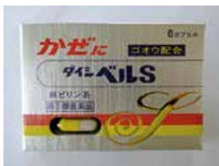
ダイシベルS (かぜ薬)