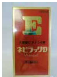
ネビラックD (手足のしびれ・冷えに)