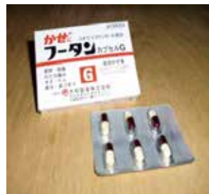
フータンカプセルG