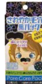
さわやか毛穴黒 パック