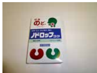
ドロップコフ(鎮咳去痰)