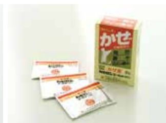
かぜロンゴールド顆粒