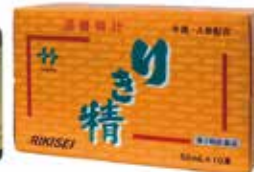
「りき精」 滋養強壮ドリンク剤