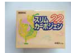
スリムカーボジェン22 (ダイエットサプリメント)