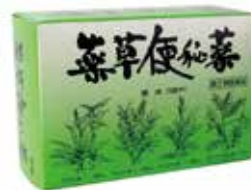
「薬草便秘薬」 生薬のみの便秘薬