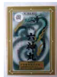
虔修六神丸 (強心薬)