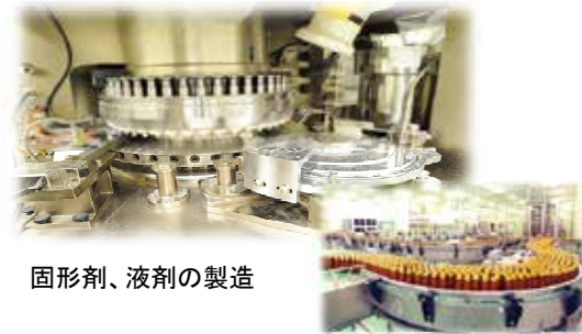
固形剤、液剤の製造