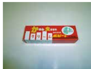
クリームポピーS(鎮痒)