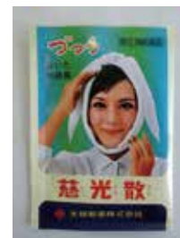
慈光散 (頭痛・肩こり・歯痛に)