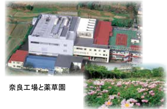
奈良工場と薬草園