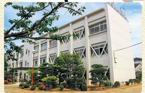
県立高等技術専門校