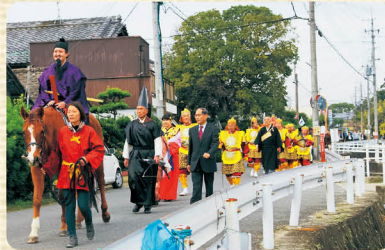
太子道のつどい(イベント)