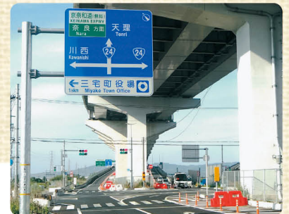
京奈和自動車道 三宅インター チェンジ