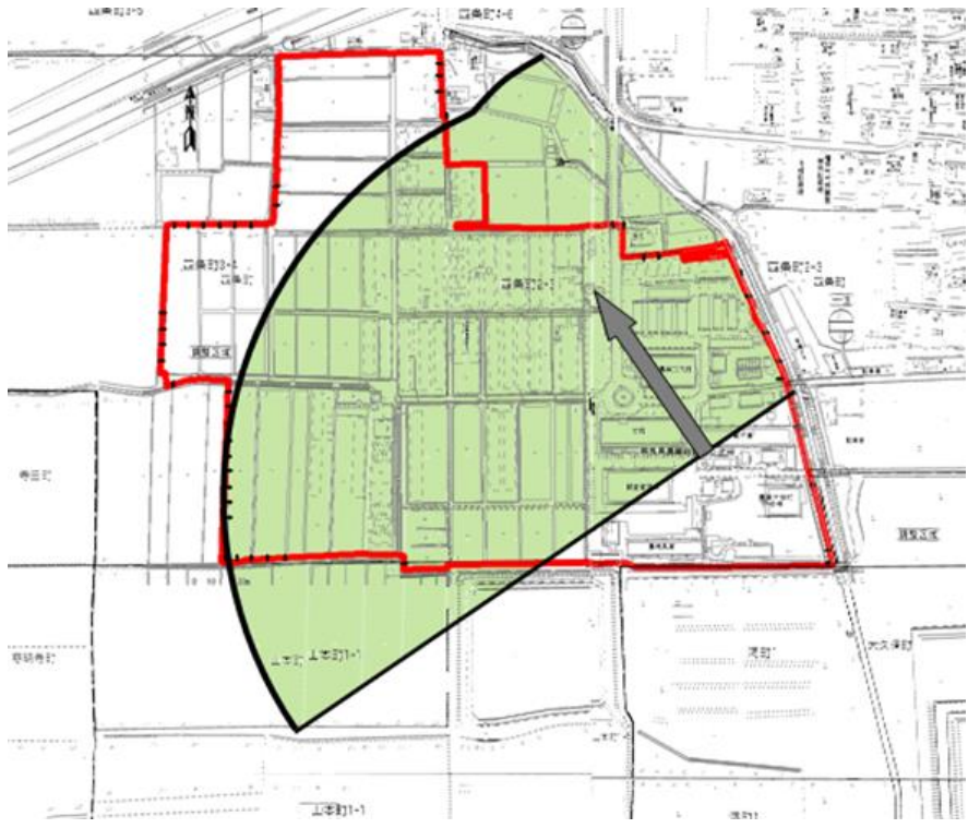
【図4】砒素 地下への影響が考えられる範囲