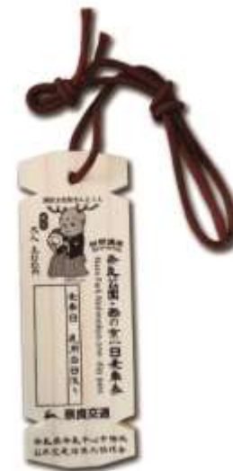
図. 木簡型一日乗車券