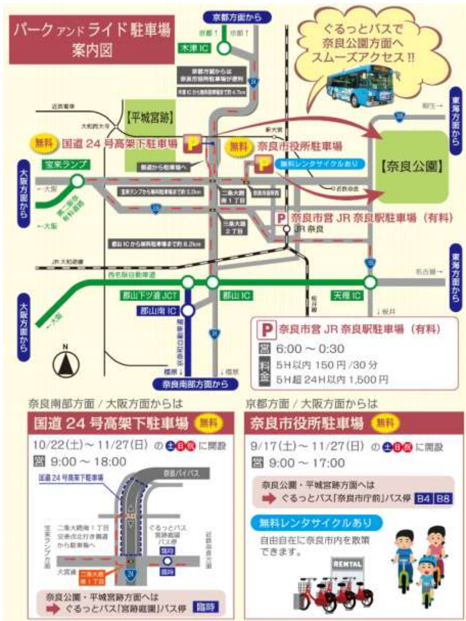
図. P&Rの実施概要 (平成28年秋季)