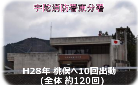
H28年 桃俣へ10回出動 （全体 約120回）