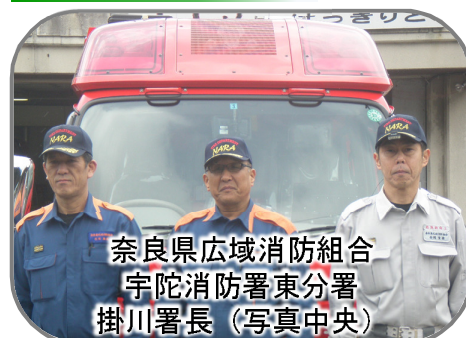
奈良県広域消防組合 宇陀消防署東分署 掛川署長（写真中央）

御杖村桃俣で火災等の災害が発生した場合、水槽付消防ポンプ自動車等の大型消防車両の走行が容易となり、現場到着時間の短縮が期待でき又、救急搬送時傷病者への負担が軽減されると期待しています。