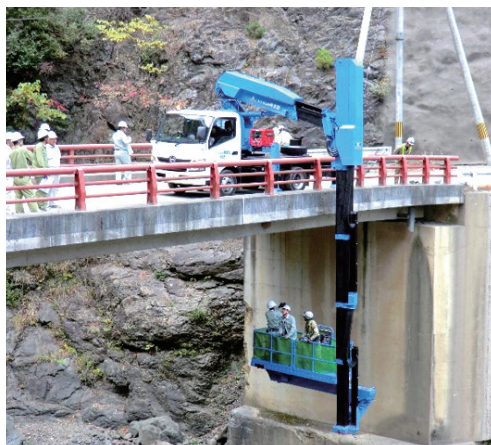
橋りょうの点検(野迫川村)