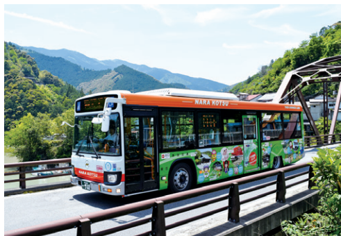
日本一長い路線バス(奈良交通株式会社:八木新宮線)