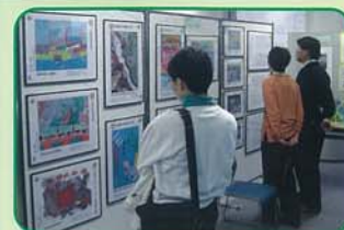
大和川コンクール入賞作品