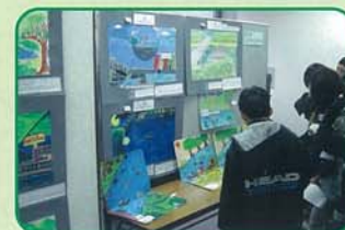
タイの子どもたちの作品