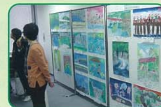
和歌山県絵画コンクール優秀作品