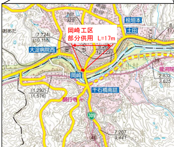
「奈良県道路網図(平28近複、第23号)を転載」