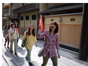
まいまい京都のツアー

講演会に参加していただいた方の中から、希望者を対象に、「 まいまい京都 」のユニークなツアーを体験していただけます。