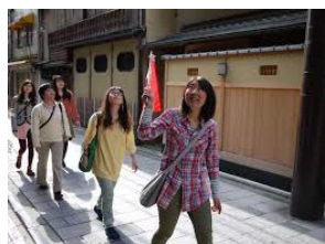
まいまい京都のツアー

講演会に参加していただいた方の中から、希望者を対象に、 「まいまい京都」のユニークなツアーを体験 していただけます。 (有料、定員あり※ ※多数の場合は抽選)