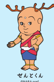
せんとくん ONARA pref.