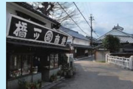
新町通り(重要伝統的建造物群保存地区)