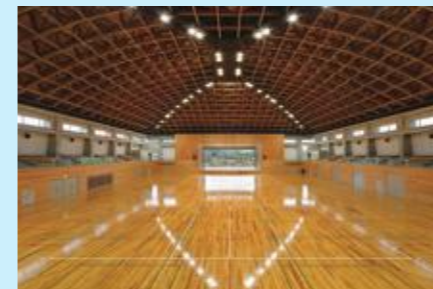
会場のシダーアリーナ(平成28年10月完成)