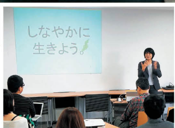
働き方改革に関する講演の様子

テレワークといっても、通常のオフィスで働くのと変わりはありません。普通は職場にある机や書類、電話が「インターネット