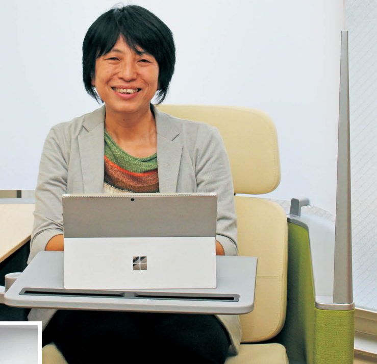
生駒市テレワーク&インキュベーションセンター「イコマド」で