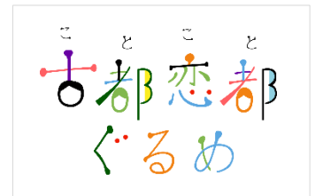
▲プロジェクトロゴ・2段階組

『古都恋都(ことこと)ぐるめ』は、「古代の人にも食べさせたい！ワンプレートランチ」をテーマに、古代の人々が食べていた食材を現代の感覚で料理する新たな“古代食レシピ”を制作・発表し、完成したレシピを実際に期間限定メニューとして提供する試みです。日本最古の歴史書『日本書紀』に書かれたチーズの原型といえる「蘇(そ)」や、醤油のルーツとなった「醤(ひしお)」等を用いながら、単なる“再現レシピ”では無い、現代の感覚でも美味しい！と思える“全く新しいレシピ”を創り出します。