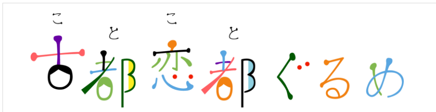
▲プロジェクトロゴ

かつて都があった奈良の伝統的な食文化を現代の人々へ新たに発信するべく、奈良女子大学“奈良の食プロジェクト”とタッグを組みレシピ開発～実際の提供までをプロデュースする“古代食グルメプロジェクト”『古都恋都(ことこと)ぐるめ』が始まります！！