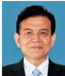
やまなか ますひろ 山中 益敏 (公明党)

問 待機児童の解消に有効な施策である企業主導型保育事業について、今後、県としてどのように取組を進めていくのか。また、保育士の確保・定着について、どのように取り組んでいくのか。